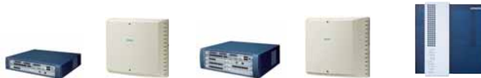
HiPath 3000 V7.0 Технические данные